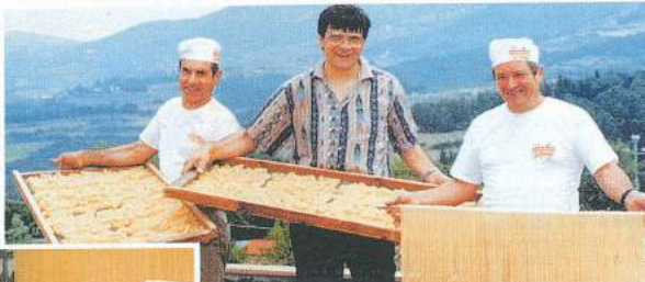
La lavorazione della pasta. Sopra, al centro il proprietario del pastificio Fabbri

wheat, through to the Val di Chiana which specialises in maize and other products, including sunflower seed. The hundred year old pasta is the top of the range and this year the Consorzio Agrario of the Province is celebrating its hundredth anniversary during which period it witnessed various events which included the inauguration of the new Consorzium